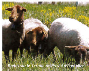
Brebis sur le terrain de Préval à Pontellier

Moins d'allers-retours à la déchèterie Moins d'entretien au quotidien Plus de temps pour profiter de son jardin ! 😊